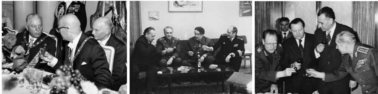
Климент Ворошилов, Борис Полевой, маршал Устинов. Вот странное дело: пить – пили, а пьяных не было

акциз – не удастся украсть акциз... Даже если и удалось, то в момент воровства акцизов в очередь встанут очень много всяких рук, с которыми надо поделиться. В итоге останется не останется – не факт. И поэтому все, кто занимается алкоголем, они на протяжении многих лет занимаются онанизмом и мастурбацией.