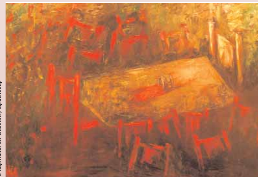
С картины П. Бабенко, Краснодар

Если в натуральное вино плеснуть глицерин, он опустится на дно сосуда, оставаясь бесцветным. Если же вместо вина – «компот», то глицерин окрасится в оттенки красного или жёлтого цвета.