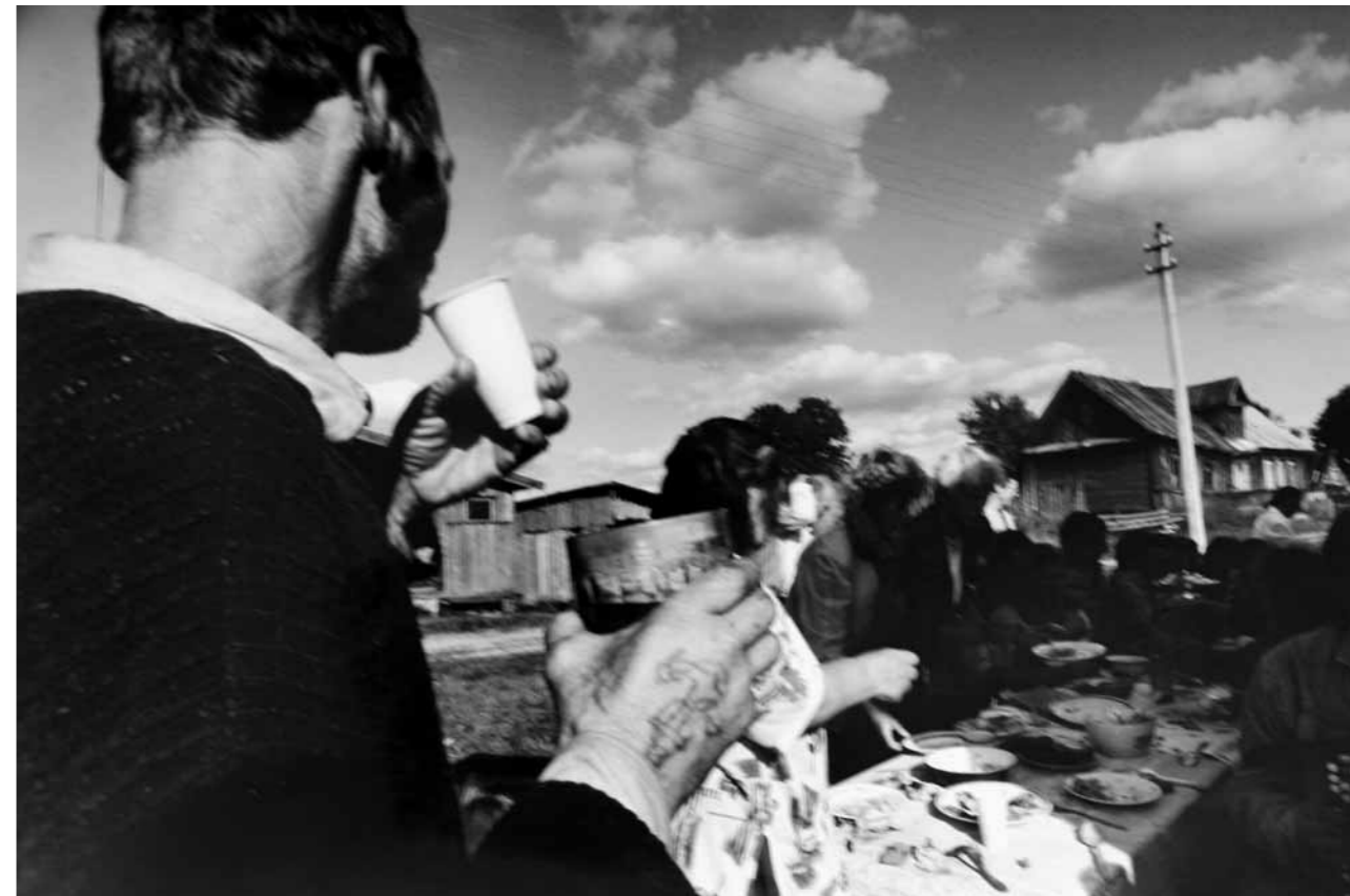
За нас с вами и хрен с ними!

Ну а третья причина – это уже чисто русская причина. Раз должность дали, значит, надо украсть. Есть механизм консолидации воровства акцизов и того же НДС, но в более скромных масштабах, конечно, чем было, но тем не менее она существует, эта причина. Но она находится под контролем правильных людей. Но не кавказских, по крайней мере.