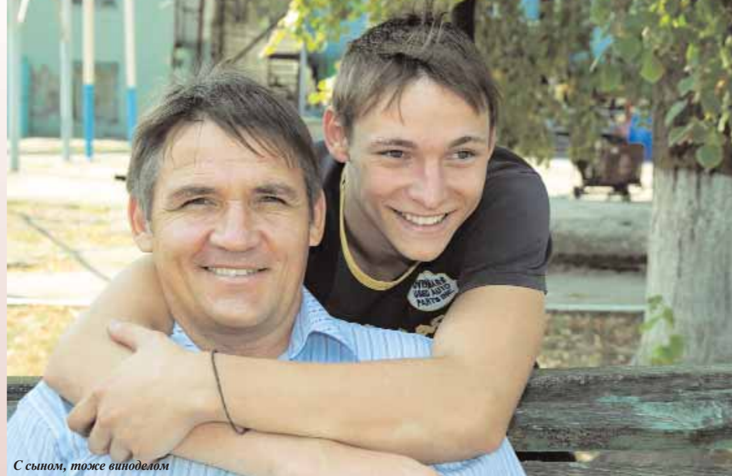
С сыном, тоже виноделом

В США уже более десяти лет производством безалкогольного вина занимается компания Ariel (Калифорния). В портфеле компании 7 безалкогольных вин, сделанных из разных сортов винограда: от инфанделя до мерло. В общей сложности такие вина производят около 20 производителей во Франции, Германии, Австралии и США. Они заняли нишу на своих рынках и работают с ней уже не первый год. Какое будущее у этих вин на славянском рынке? Как известно, безалкогольное пиво не пошло. А про трезвое винцо в той же Украине говорят по-своему ярко: секс без дивчины – признак дурачины. Пить безалкогольное вино – это все равно, что играть в футбол без мяча. И дорого: по мнению «народа», безалкогольное вино должно стоить значительно дешевле традиционного, ведь оно лишено одной из своих характеристик – алкоголя.