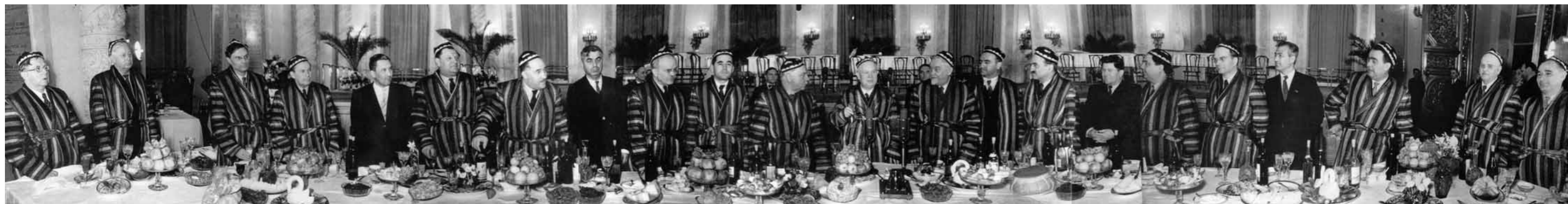
Третий с правого края – Л. Брежнев. Остальных узнавайте сами