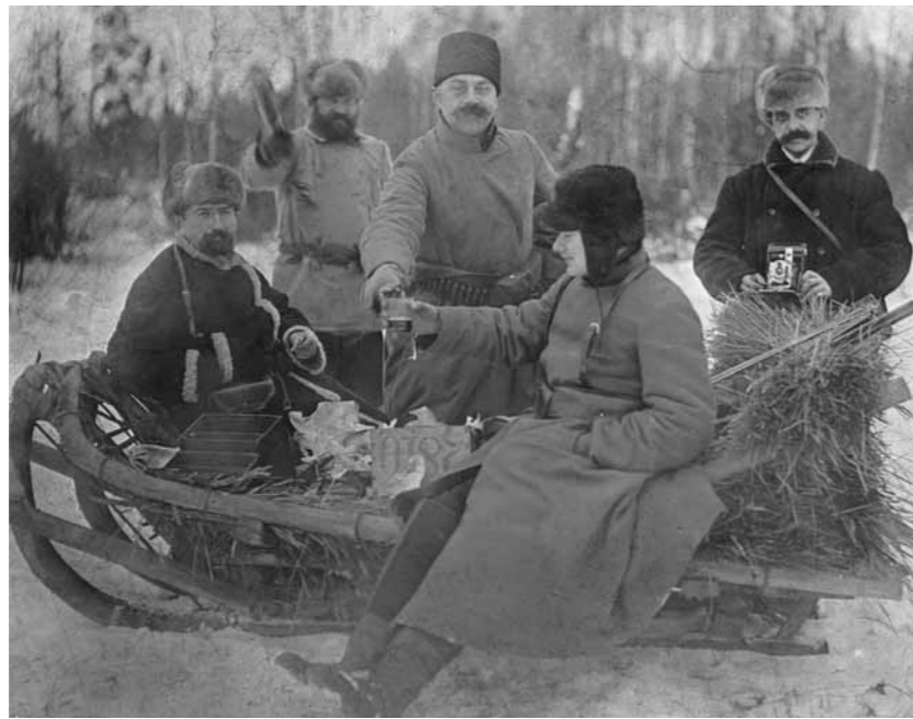
За веру, царя и Отечество

Ничего черно-белого нету. Ни в жизни, ни в нашей отрасли. Всё в полутонах находится. Есть некая стратегическая задача, которая поставлена руководством страны – МАКСИМАЛЬНО СОКРАТИТЬ ОБОРОТ НЕЛЕГАЛЬНОГО АЛКОГОЛЯ. Имеется в виду алкоголь, с которого не уплачен акцизный налог. Высасывать деньги из углеводородного сырья пока ещё можно, пока цены есть, но надо выкачивать ещё откуда-то. Промышленность не работает. Ин-