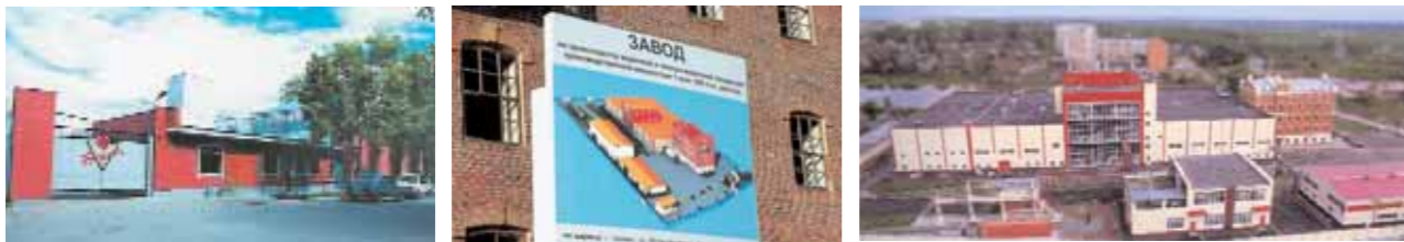
Три фото — три жизни тюменского «Бената»: старые ворота старого завода, макет мечты, и вот он, новый «Бенат»!