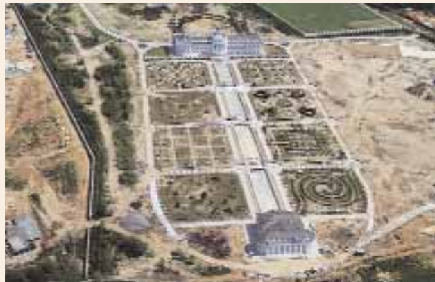
Самое смешное, что это не «Дворец Путина», а всего лишь «дача Миллера», от которой сегодня глава Газпрома тоже стремительно открешивается.