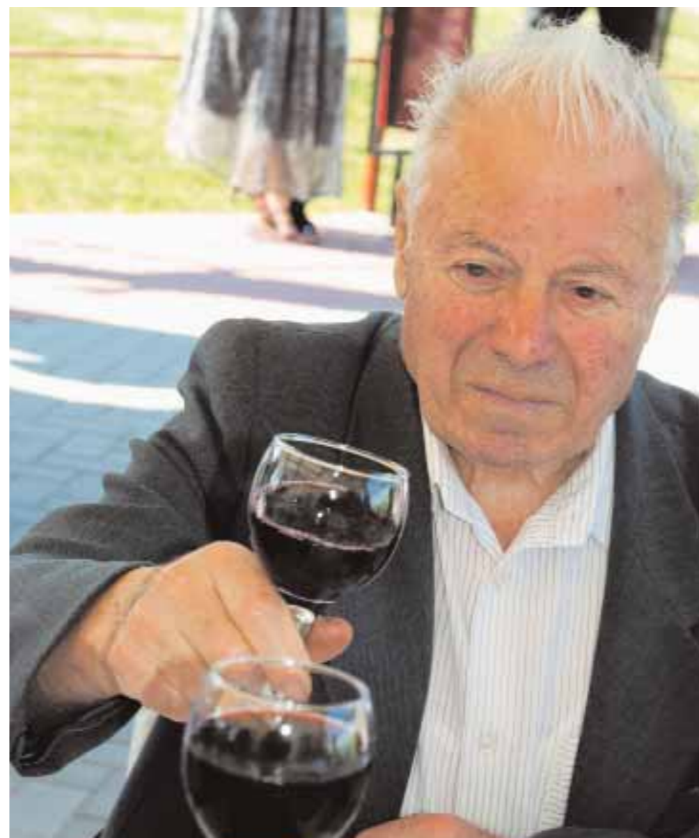
Неожиданно большая и весёлая делегация виноделов из Франции — прикольные мужики!

«Цимлянские вина» делают ставку на выращивание аборигенных сортов винограда. Вино «Цимлянское игристое, приготовленное старым казачьим способом, завоевало 12 ГРАН-ПРИ и 19 золотых медалей. На дегустационном конкурсе International Wine & Spirits Competition в рамках выставки London International Wine & Spirits Fair 2011 вино удостоилось серебряной медали. Итак, наша самобытность снова получила международное признание