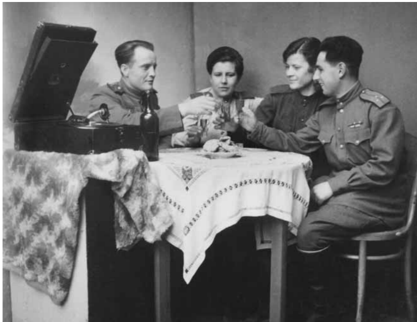
За Родину, за Сталина!

новационные технологии не заработали. Сколково не заработает, скорее всего. Откуда ещё можно деньги качать в виде налогов? Из акцизов. А акцизами что облагается? Нефть, золото (драгоценности) и алкоголь с сигаретами. Поэтому деньги нужно собрать в бюджет, чтобы не вызвать социальный взрыв. Пенсии нужно платить, ибо пенсионная реформа не заработала, а деньги где-то брать надо. Поэтому и было принято решение – обеспечить поступление денег в бюджет России от производства и продажи алкоголя. И сигарет. Пока ещё за золото не взялись – в золоте денег гораздо больше, чем в алкоголе (в незаконном обороте золота, драгоценных камней и бриллиантов). Надо собрать деньги! Пенсионерам надо платить пенсию. Полицаям поднимают зарплату – надо