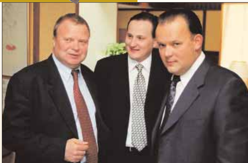
Основатели «Ладоги» и «Росалко» — была когда-то такая дельная организация...