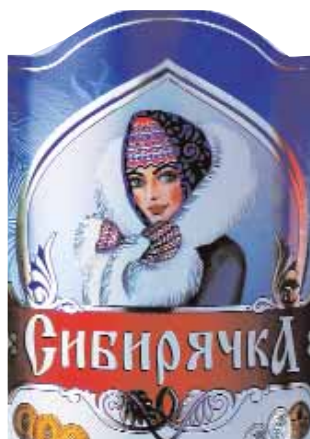
"Сибирячку" написали с натуры. Здесь, на Алтае, каждая сибирячка - это такая натура!