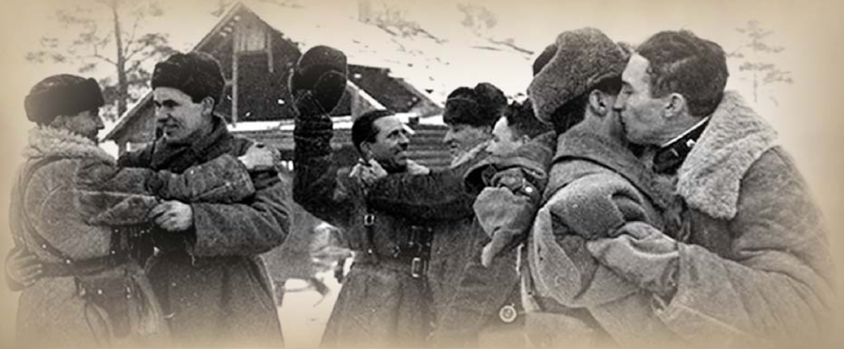
Встреча бойцов Волховского и Ленинградского фронтов, 1943

Все эти длинные и страшно умные вещи мне в разные годы говорили разные люди. А я им в ответ — свою историю из собственного детства. Про то, как отец прислал на Дон из Ленинграда большую блокадницу, а мои жёсткие и такие разные в общем казаки, не сговариваясь, открыли для себя то, что годы спустя откроет лауреат Нобелевской премии. Не скажу, не знаю, насколько эту историю можно считать военной. Но сегодня, когда в стране идёт новая война — тихая, мрачная, для многих и незаметная, история моего отца, история моей донской станицы Мальчевской могут стать примером для создания истории новой России.